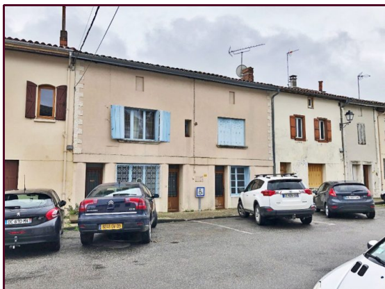
Potentiel de revenu