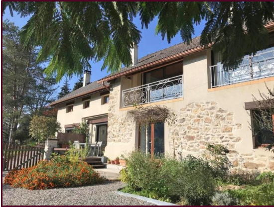
Potentiel de revenu